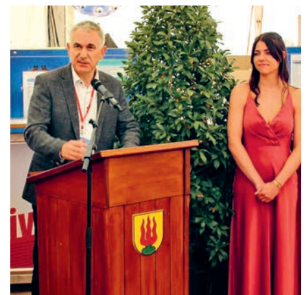
Regierungsrat Alex Hürzeler bei der Ansprache.

Der Samstag gehörte den Wettkämpfern. Nebst dem auf dem Rhein stattfindenden Wettkampf bei schönstem Sommerwetter wurden am Samstagmorgen die Ehrengäste empfangen, mit einigen Erläuterungen über das Festgelände geführt und verpflegt. Bei den Ehrengästen waren nebst vielen Sponsoren und Vertreter der Schweizer Armee sowie des Schweizerischen Pontonier Sportverbandes