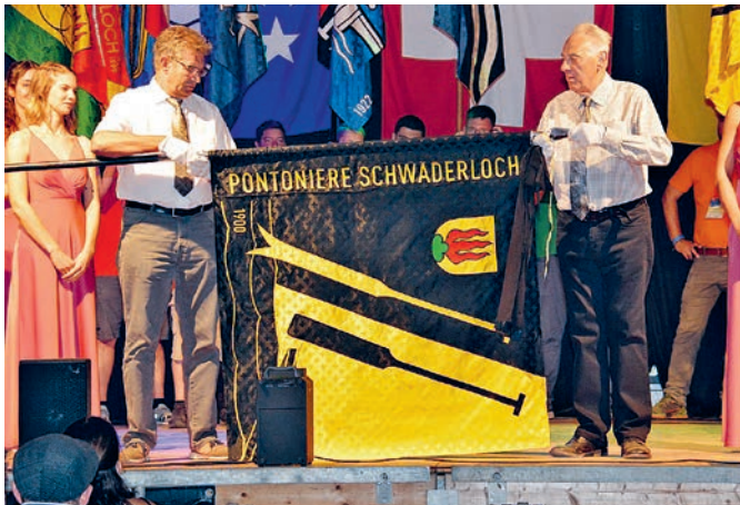
Enthüllung der neuen Vereinsfahne der Pontoniere Schwaderloch durch Fahngötti und Fahngotte.