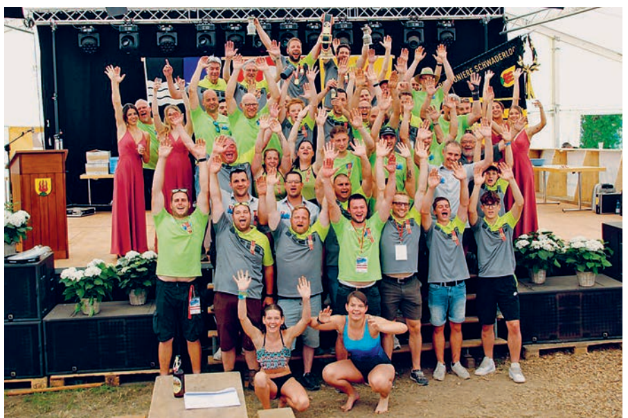
Pontoniere Schwaderloch nach der Rangverkündigung.